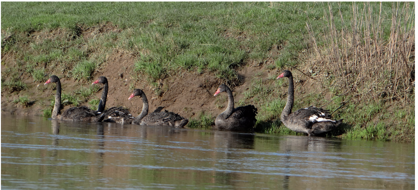
Foto: Trauerschwäne an der Leine, März 2022