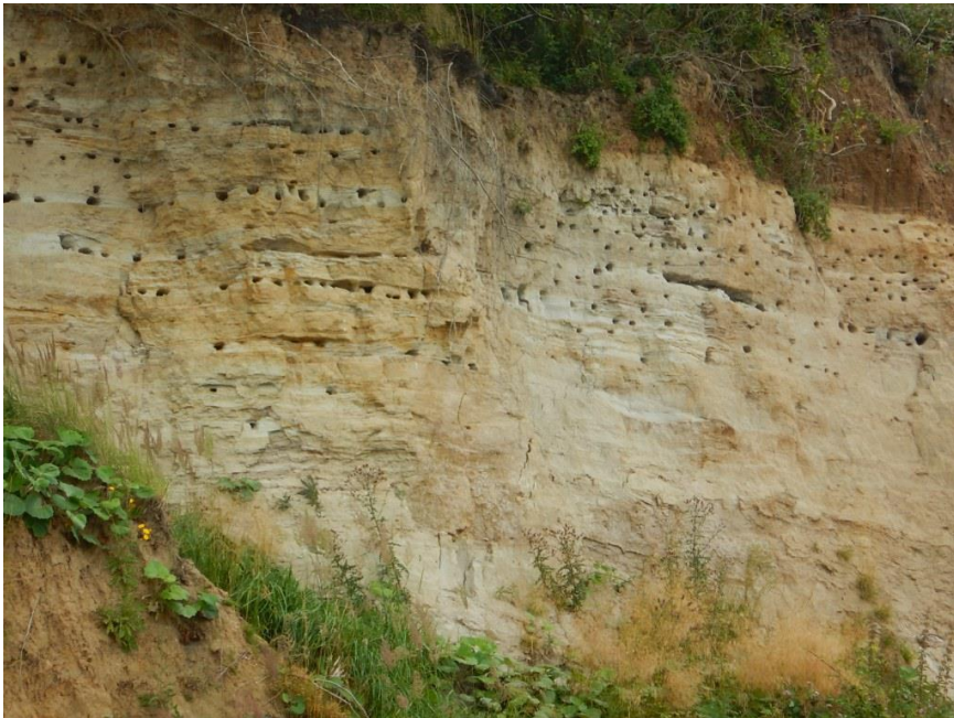
An der Westseite der Insel