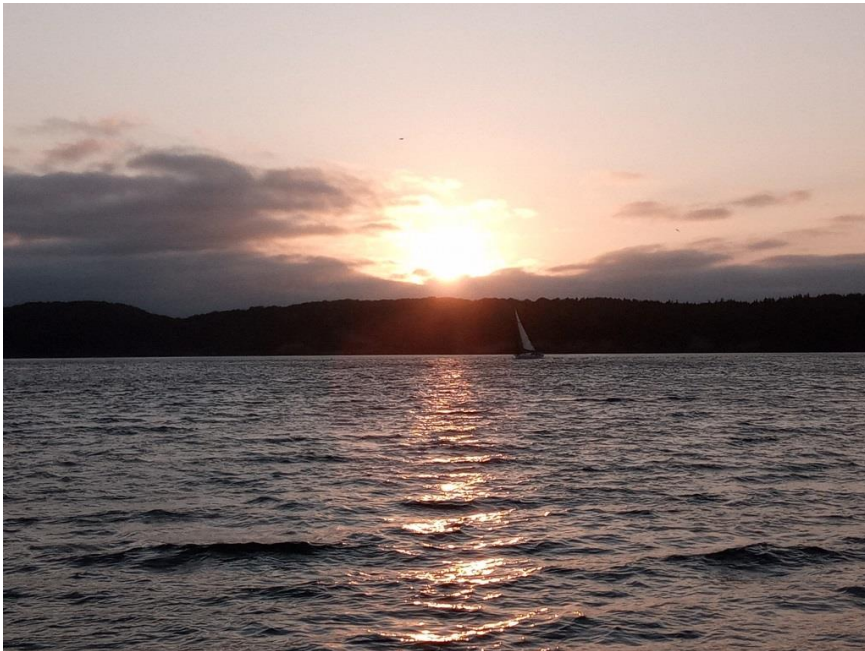
Umrundung von Fænø: Claudia an der Nordspitze